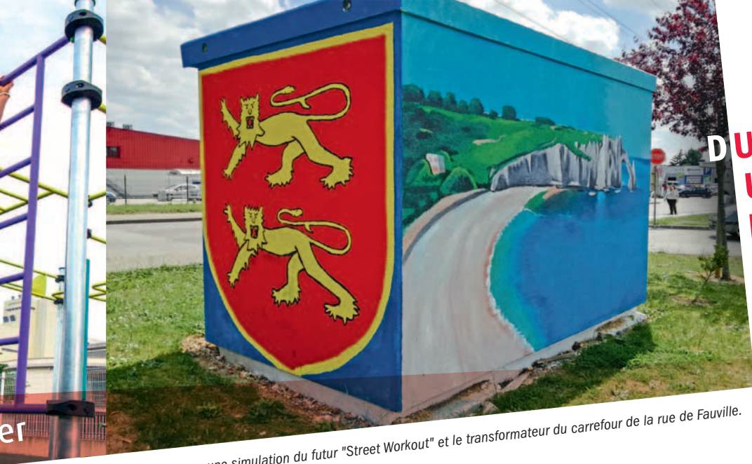
Ci-dessus, une simulation du futur "Street Workout" et le transformateur du carrefour de la rue de Fauville.

DU NOUVEAU POUR UN ENVIRONNEMENT PLUS VIVANT !