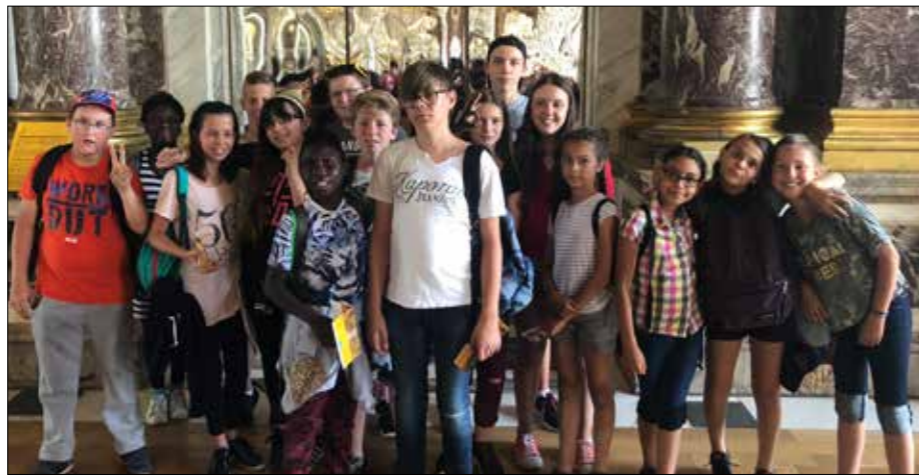
Photo souvenir dans la célèbre galerie des glaces lors d'une sortie culturelle au château de Versailles.

Anime ton play : sport sur les playground de Nétreville et La Madeleine les 17 et 26 juillet